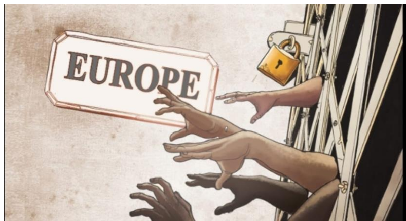
Tekening die één van de bewoners maakte n.a.v. zijn traject in de opvang.

De interviews zijn met toestemming van de respondenten worden opgenomen en de geluidsfragmenten zijn vervolgens schriftelijk worden samengevat. Om de data te analyseren is gebruik gemaakt van MAX QDA; kwalitatieve data-analyse software. In dit programma zal een codeboom worden opgesteld aan de hand van de onderzoeksvragen en andere veel voorkomende thema's in de interviews. De interviews en documenten zullen vervolgens aan de hand hiervan worden gecodeerd en geanalyseerd. Door ook aparte codes te maken voor verschillende locaties, kunnen deze daarnaast ook makkelijker met elkaar vergeleken worden.