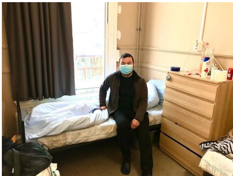
Een bewoner laat zijn kamer in de opvang zien.

De specifieke focus op perspectief komt voort uit ervaring in de BBB- opvang dat bewoners weinig eigenaarschap en regie over hun toekomst ervaarden. Doel van de nieuwe vorm van opvang is dat deze bijdraagt aan de ontwikkeling van eigenaarschap en regie over hun toekomst, oftewel perspectief.