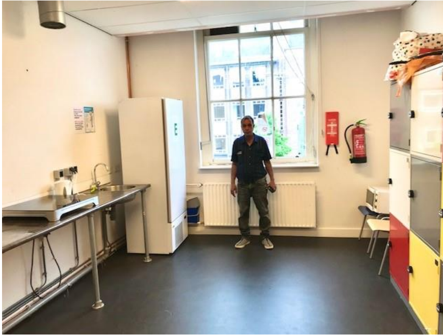
Een bewoner laat de gezamenlijke keuken in zijn woning zien.

Echter leven veel van de bewoners grotendeels gescheiden van elkaar, aldus de bewoners en ondersteuners. Een bewoner zegt hierover: " Mensen leven erg op zichzelf. Er is geen cohesie. " Een andere bewoner zegt: " Als mensen problemen hebben laten ze elkaar met rust. Soms helpen ze elkaar wel met eten, koffie of een sigaret. " Kamergenoten lijken iets vaker naar elkaar toe te trekken. Een bewoner zegt hierover: " Ik heb een kamergenoot, die is heel relaxed. We koken soms samen en we praten soms over hun persoonlijke situatie. We hebben een vergelijkbare situatie en steunen elkaar. En we houden rekening met elkaar m.b.t. geluid. "