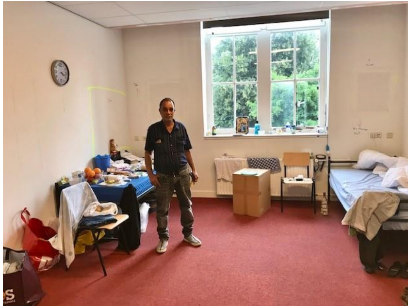
Als één van de weinig bewoners heeft deze meneer een eigen kamer.

kwetsbare bewoners, bijvoorbeeld de bewoners met psychische klachten, somatische problemen en de LHBTIQ+ doelgroep, geven in diverse gevallen aan een eigen kamer nodig te hebben. Bijvoorbeeld omdat ze zich niet veilig voelen op een gedeelde kamer en/of hun verstoorde dag en nachtritme problematisch is voor de (nacht)rust van andere bewoners.