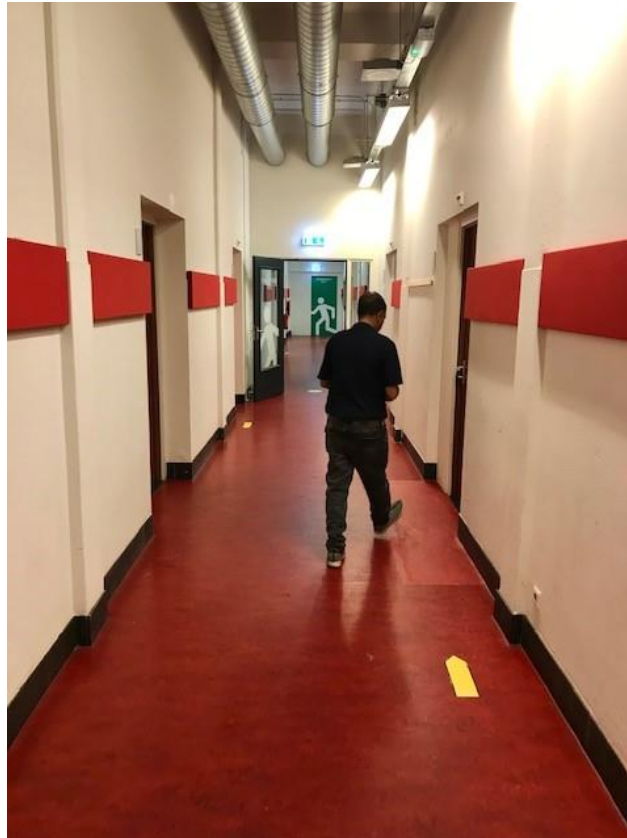
Eén van de gangen van de opvang aan de Plantage Muidergracht.

aantal bewoners betreft zal dit geen grote gevolgen hebben voor de representativiteit van de steekproef. Daarnaast hebben medebewoners, medewerkers en ketenpartners wel over deze groepen vertelt, waardoor hun verhaal indirect toch is meegenomen. Hieronder is de gevonden data beschreven aan de hand van de eerder gestelde deelvragen.