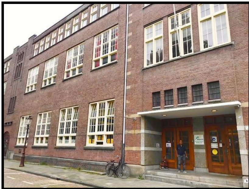
Eén van de bewoners voor de ingang van de Plantage Muidergracht.