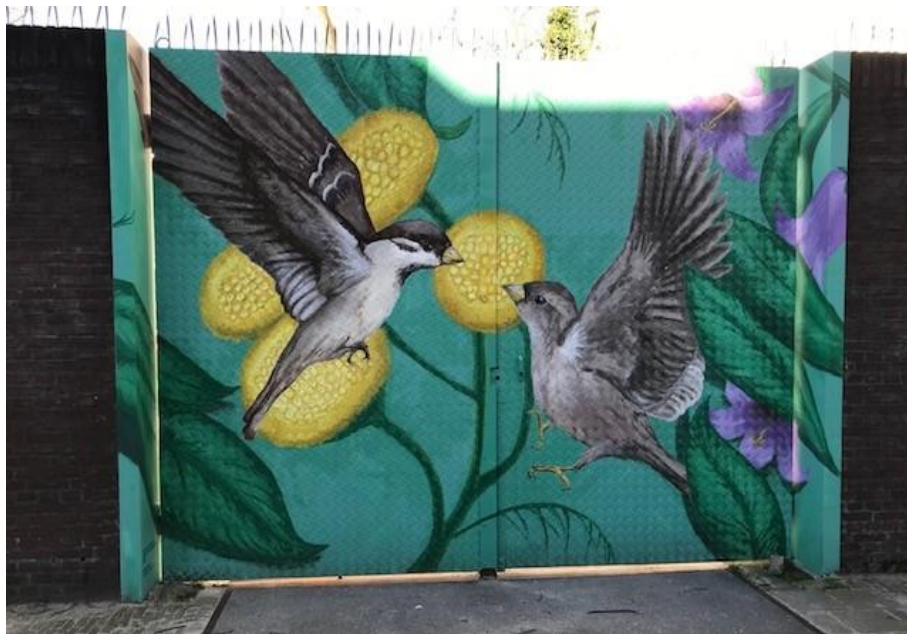
Schildering die een bewoner voor de buurt, op een hek naast de opvang, heeft gemaakt.

er wat verwarring is ontstaan over de rol van de medewerkers hierbij: "Ik zou zelf graag meer willen doen voor de bewoners. Maar eerder ben ik teruggefloten. Dan gingen we met tien man koken. Maar dat mocht dan niet, want het is zelfbeheer. (...) De bewoners vonden de kookavonden erg leuk. Anders koken ze voor zichzelf en praten ze nauwelijks met elkaar. Voorheen aten ze wel samen en eten verbindt. Dan kwamen er ook problemen naar boven. De bewoners gingen daarna zelf aan de slag. En namen meer initiatief. Ze hadden gewoon een zetje nodig."